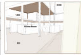
Mediathek über 3 Etagen - offener Raum mit flexibler Decke