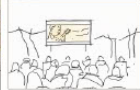
KIRCHE Die aktuellen Bauprojekte der Stadtteile begrenzen die Möglichkeiten, die eine zukunftsreiche Struktur bringt. Eine moderne Kirche sollte offene Diskussionsräume bieten - öffentlich, flexibel und vielfältig. Sie soll als Zentrum für die Erziehung, Weiterbildung und Umsetzung innovativer Ideen dienen. Dabei werden alle gefordert sein: Die Kirchgemeinde, aber auch die Anwohner und die Schüler. Die Kirche wird als ein zentraler Ort für die Begegnung und den Austausch gesehen. Die Kirche wird als ein zentraler Ort für die Begegnung und den Austausch gesehen. Die Kirche wird als ein zentraler Ort für die Begegnung und den Austausch gesehen.