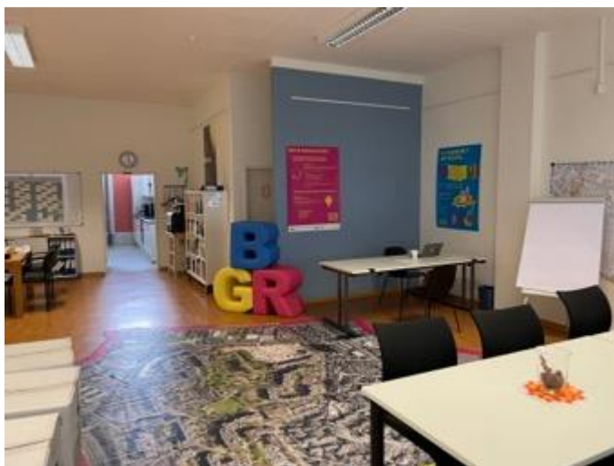
ISEK Handlungsfeld 2 Aktivierung & Beteiligung: Quartiersmanagement

Denkt daran, das Quartiersbüro ist für alle da! Es steht den Bewohner:innen kostenfrei für Ausstellungen, Workshops, Kurse oder anderweitige Nutzung zur Verfügung. Bei Bedarf könnt ihr euch jederzeit an das Quartiersmanagement wenden.