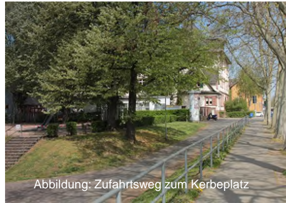
Abbildung: Zufahrtsweg zum Kerbeplatz