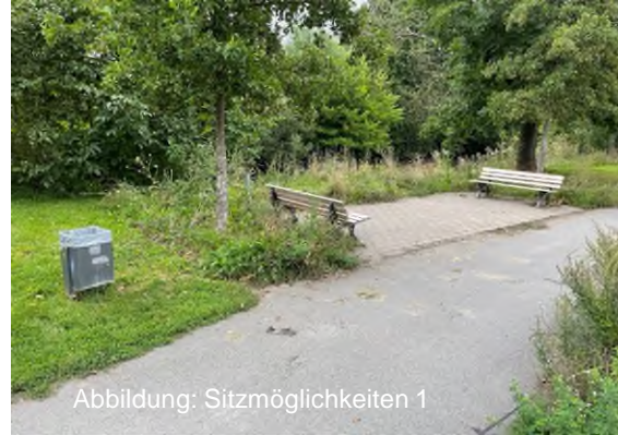
Abbildung: Sitzmöglichkeiten 1