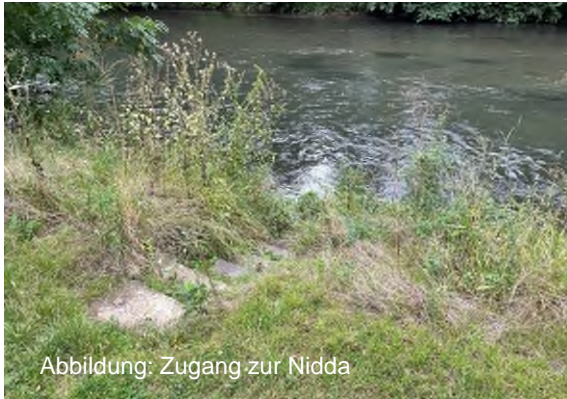
Abbildung: Zugang zur Nidda