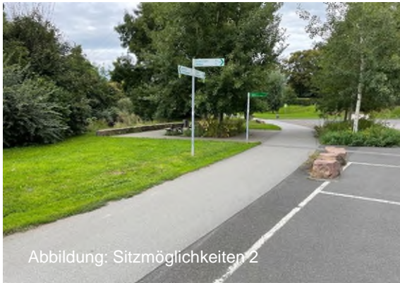
Abbildung: Sitzmöglichkeiten 2