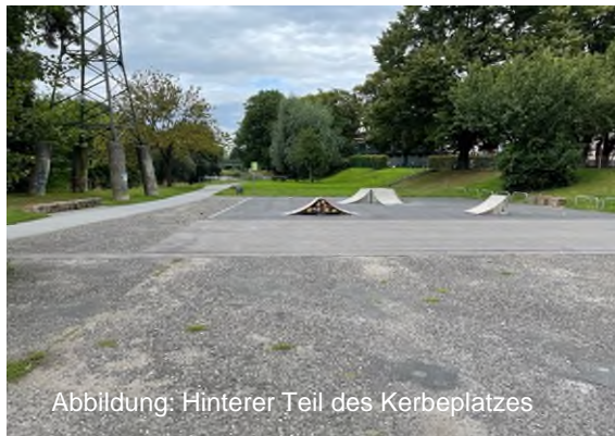
Abbildung: Hinterer Teil des Kerbeplatzes