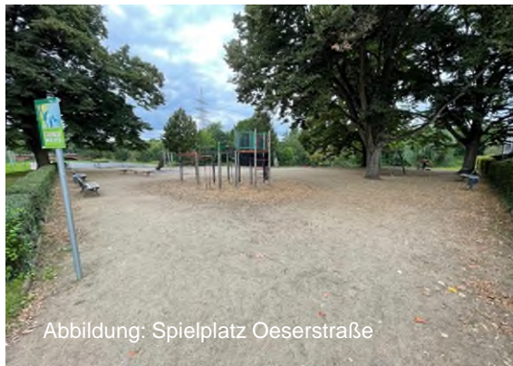
Abbildung: Spielplatz Oeserstraße