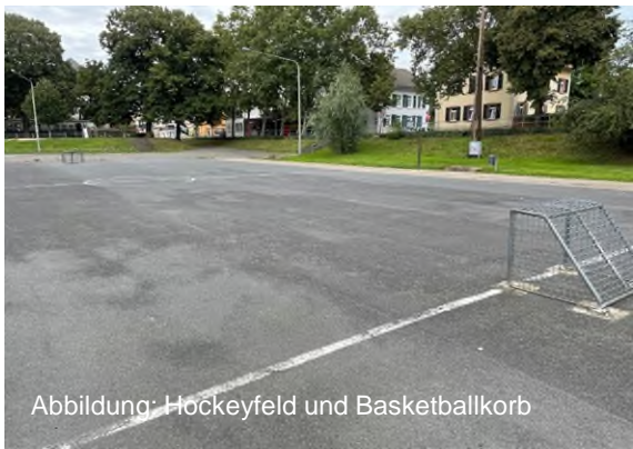
Abbildung: Hockeyfeld und Basketballkorb