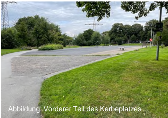
Abbildung: Vorderer Teil des Kerbeplatzes