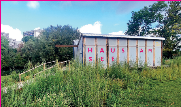
HAUS AM SEE

Das Quartiersbüro liegt in der Ladenzeile Ben Gurion-Ring 56 und ist die zentrale Anlaufstelle für alle Bewohner:innen. Das Quartiersbüro steht allen kostenfrei für Feste, Ausstellungen, Workshops, Kurse etc. zur Verfügung. Seit Dezember 2024 steht für weitere Aktivitäten das HAUS AM SEE zur Verfügung. Es bietet im Innenraum, der auch eine kleine Küchenzeile beinhaltet, Platz für ca. 30 Leute. Bei Interesse der regelmäßigen Belegung der Räumlichkeiten meldet Euch bei uns im Quartiersbüro.