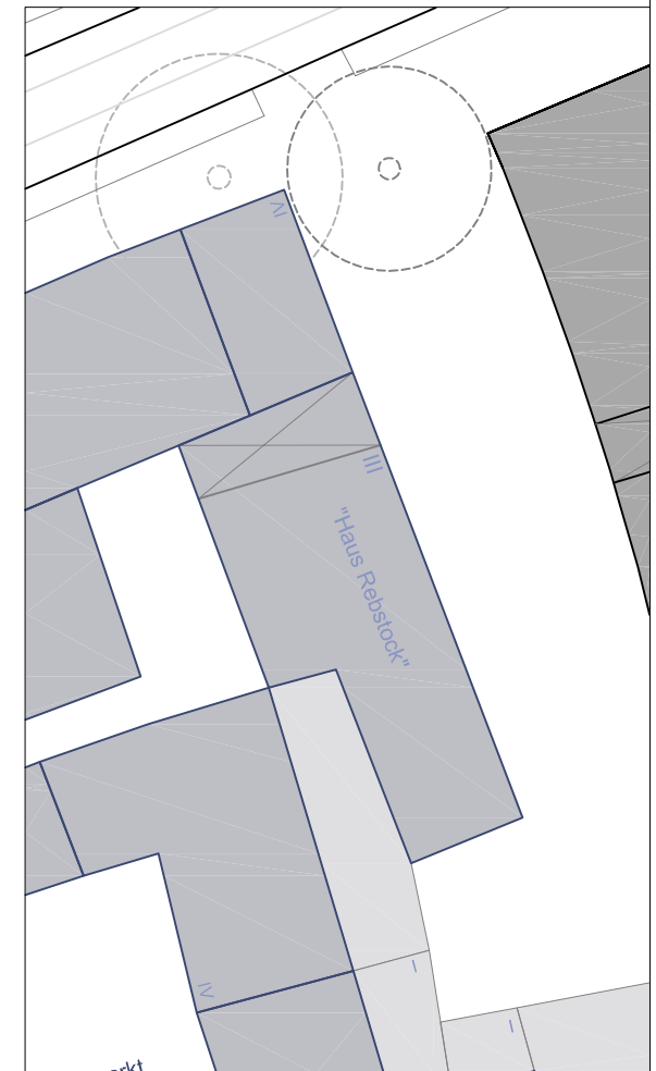
Alternativplanung "Haus Rebstock" wird vom Magistrat geprüft