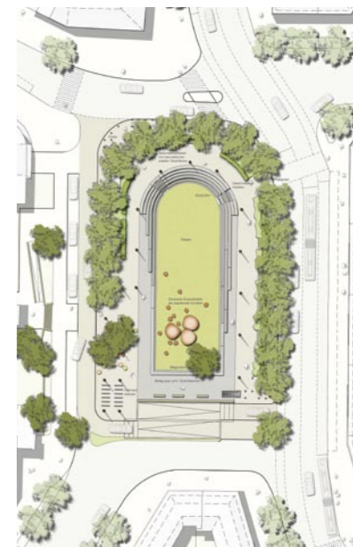
Variante 1; Götte Landschaftsarchitekten

wurde das Büro KuBuS Freiraumplanung mit der Entwurfsplanung für den Platz und das Rosengärtchen beauftragt.