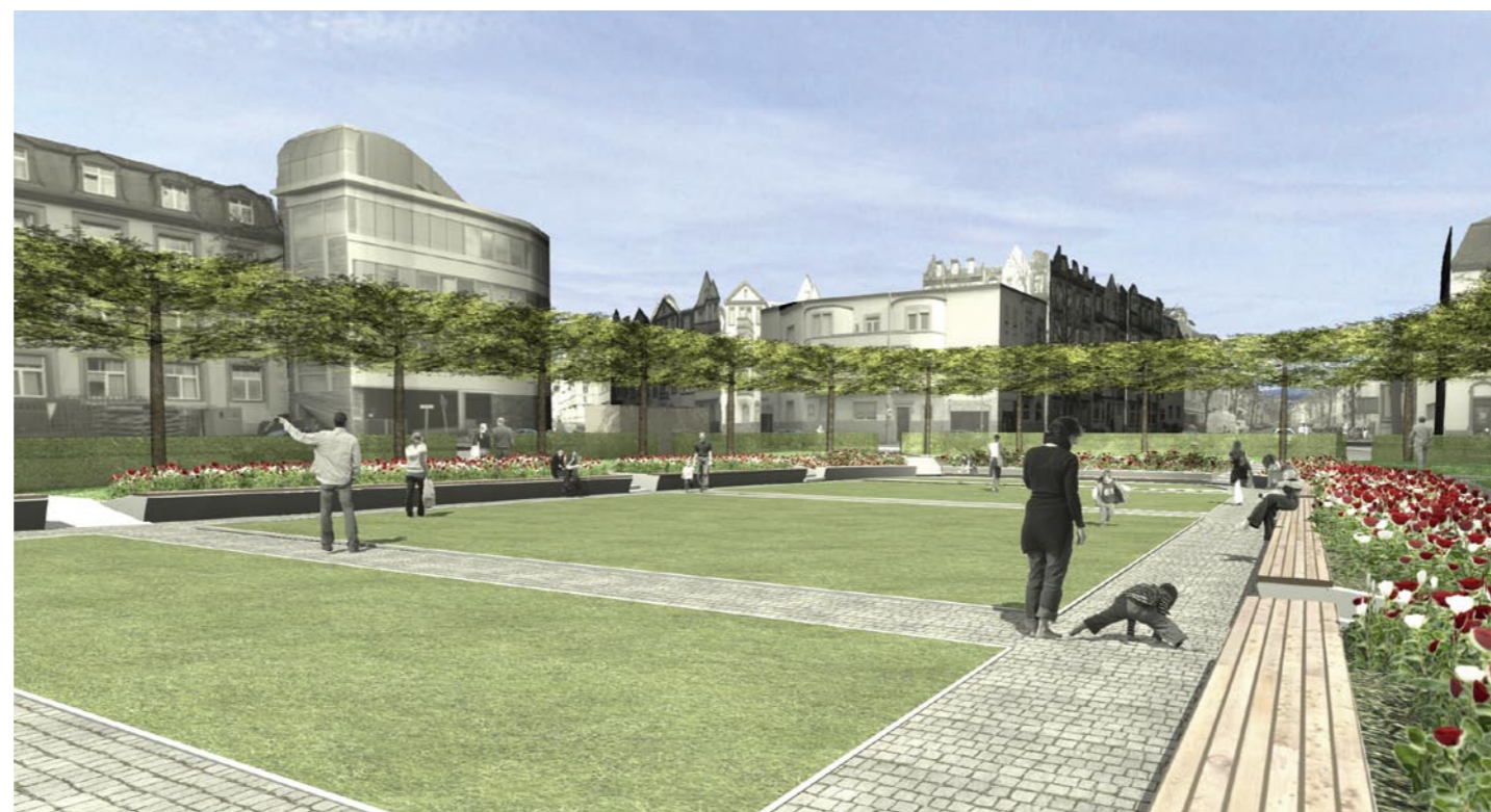
Perspektive © Kubus Freiraumplanung Wetzlar/Berlin

Die Einmündung des Prüflings südlich der Krankhausvorfahrt wird eingeeengt, um Durchgangsverkehr von Norden nach Süden zukünftig zu unterbinden. Lediglich Notfalltransporten und Fahrradfahrern ist die Durchfahrt von Norden nach Süden gestattet.