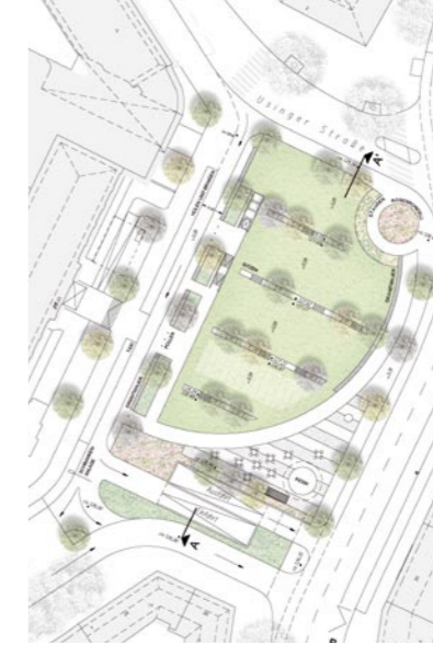
Variante B, Ipach und Dreibusch Landschaftsarchitekten (vom Bestand gelöst)

In der ersten Veranstaltung wurde zunächst die Aufgabenstellung für die Büros vorgestellt. Darauf folgte eine vierwöchige Bearbeitungsphase.