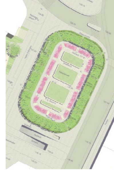
Variante Hippodrom, Kubus Freiraumplanung

In der zweiten Veranstaltung präsentierten die Büros ihre Konzeptideen. Der Ortsbeirat und die Bürgerinnen und Bürger konnten in beiden Veranstaltungen Anregungen äußern, die aufgenommen und nach einer fachlichen Abwägung in das Verfahren eingestellt wurden.