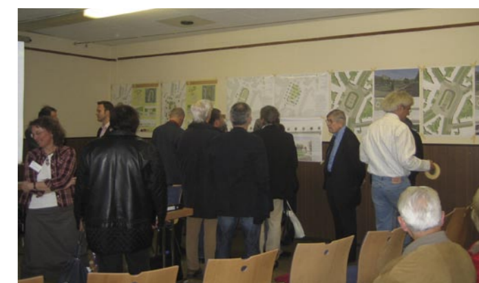
Diskussion an den Plänen