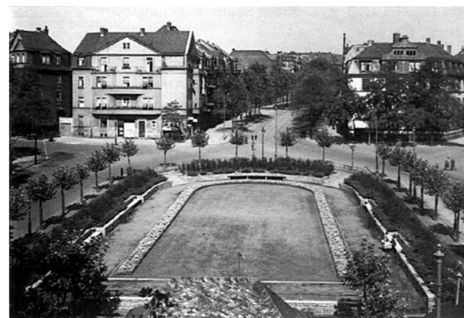
Vogelschaubild kurz nach der Fertigstellung